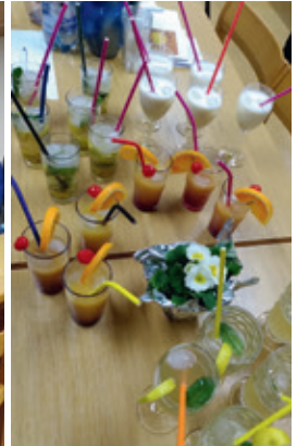
Kontakttreffen Region Norden am 11.01.2024 in Hornussen