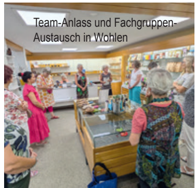
Team-Anlass und Fachgruppen-Austausch in Wohlen