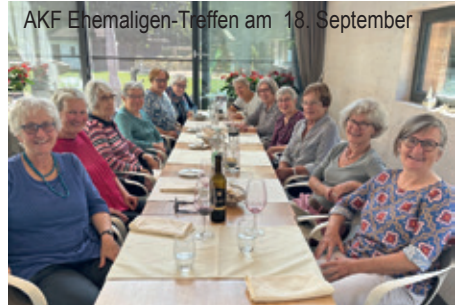
AKF Ehemaligen-Treffen am 18. September