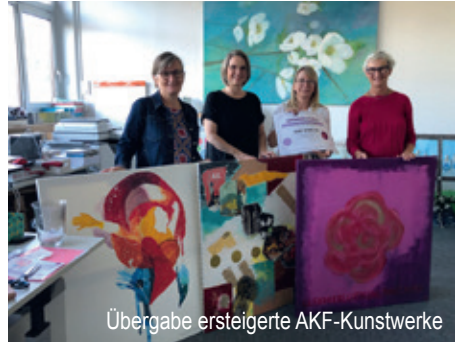
Übergabe ersteigerte AKF-Kunstwerke