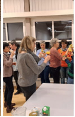
Kontakttreffen Region Süden / Westen am 23.01.2024 in Mühlau