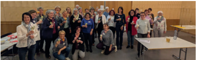
Kontakttreffen Region Osten am 26.04.2024 in Baden