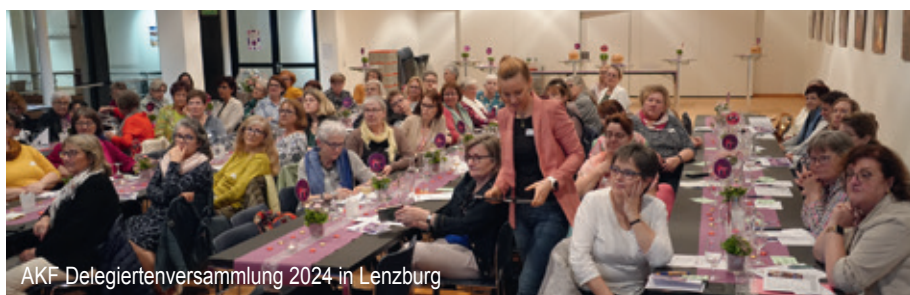
AKF Delegiertenversammlung 2024 in Lenzburg