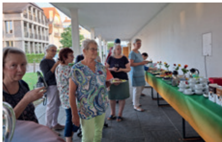
Sternmarsch am 22. August.2024 in Aarau