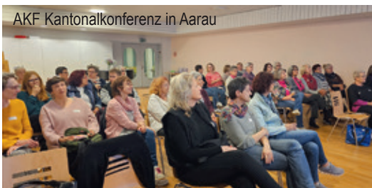
AKF Kantonalenkonferenz in Aarau

AKF Aargauischer Katholischer Frauenbund Spirituell. Sozial. Politisch.