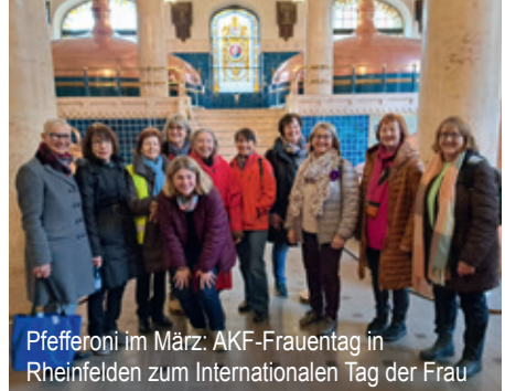
Pfefferoni im März: AKF-Frauentag in Rheinfelden zum Internationalen Tag der Frau