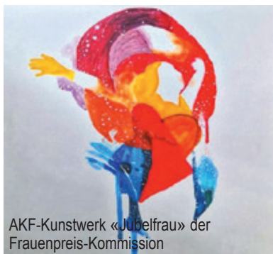
AKF-Kunstwerk «Jubelfrau» der Frauenpreis-Kommission