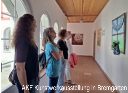
AKF Kunstwerksausstellung in Bremgarten